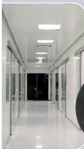
ЧИСТЫЕ ПОМЕЩЕНИЯ панели, двери, окна