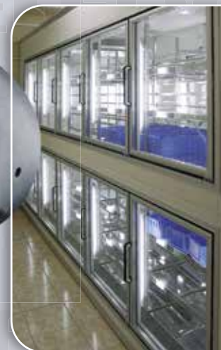
СТЕКЛЯННЫЕ ФРОНТЫ для холодильных камер