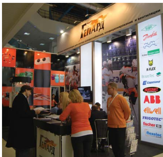
Динамика развития выставки «Мир климата»