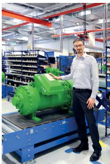
Начиная с 1 апреля 2015 года, BITZER стал применять QR коды для всей своей продукции.

Начиная с 1 апреля 2015 года, BITZER стал применять QR коды для всей своей продукции, предоставляя заказчикам возможность использовать