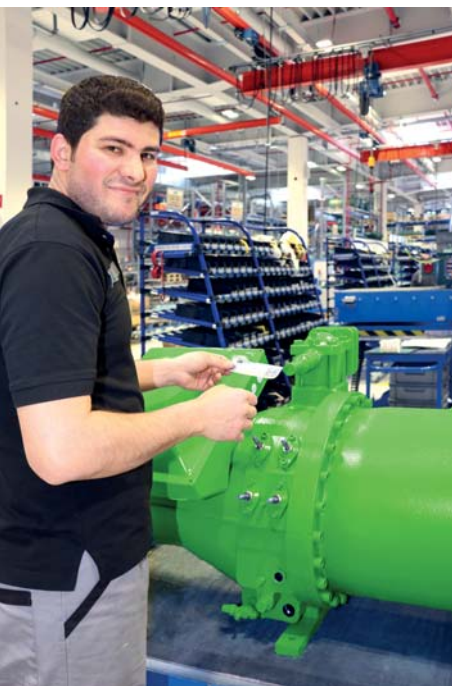
QR-код присваивается к каждому продукту BITZER для облегчения проверки подлинности и получения дополнительной информации.

ра маслом, его габаритным и присоединительным размерам, а также информацию о запасных частях и рекомендации по применению. При сканировании QR-кода можно также получить всю необходимую информацию о компрессоре непосредственно в программе подбора BITZER Software.