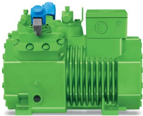
Компрессоры BITZER также доступны с предварительно смонтированными на заводе головками цилиндров CR11.

дровых компрессоров, тандем-компрессоры могут работать с частичной производительностью даже до 5%. Сердцем системы CR11