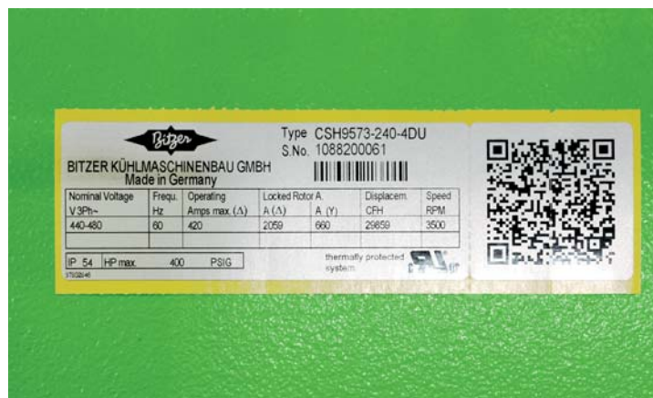
QR коды предоставляют заказчикам возможность использовать простое стандартное приложение на смартфоне для проверки подлинности продукции.

Производители подделок наносят не только большой экономический ущерб всей отрасли, но их продукция может представлять собой опасность, так как она зачастую не соответствует требованиям и эксплуатационным нормам, которые установлены для холодильной и климатической отраслей применения.