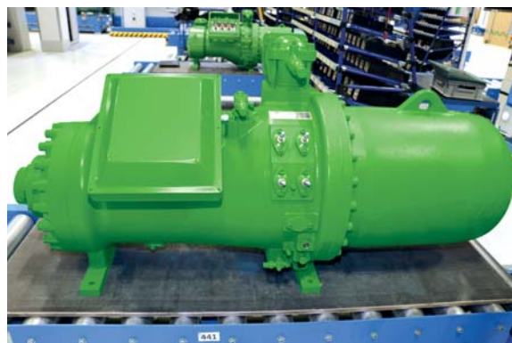
QR-код дает дополнительные преимущества, предлагая заказчикам прямой онлайн доступ к сервисам BITZER.

эксплуатации, техническую документацию по эл. подключению, заправке компрессо-